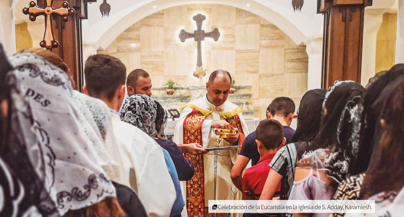
Celebración de la Eucaristía en la iglesia de S. Adday, Karamlesh.